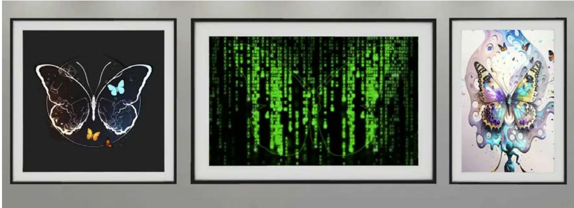
Galerie virtuelle – Mariposa

En plus du site internet, il vous est possible d'aller voir l'exposition virtuelle de Mariposa depuis ce lien .